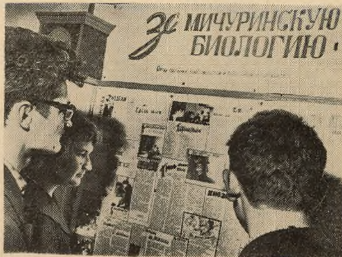
Выпушчан новы нумар газеты «За мичуринскую біялогію». Пачытаць яе збіраюцца не толькі біёлагі. Што ж цікавае ёсць у газеце па гэты раз?

Чытач напружана сочыць за тым, як калектыў брыгады перырыма аднёсся да выпадку